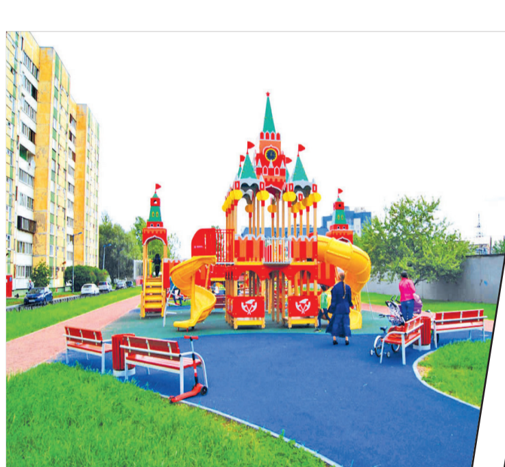
Комплексное благоустройство (обустройство детской и спортивной площадок, пешеходной зоны, озеленение)